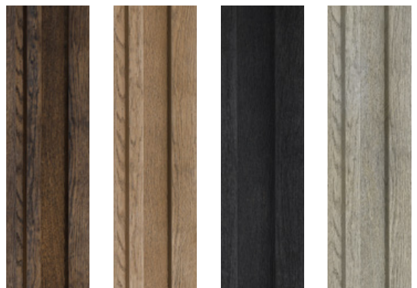
Antique Oak Golden Oak Burnt Cedar Smoked Oak