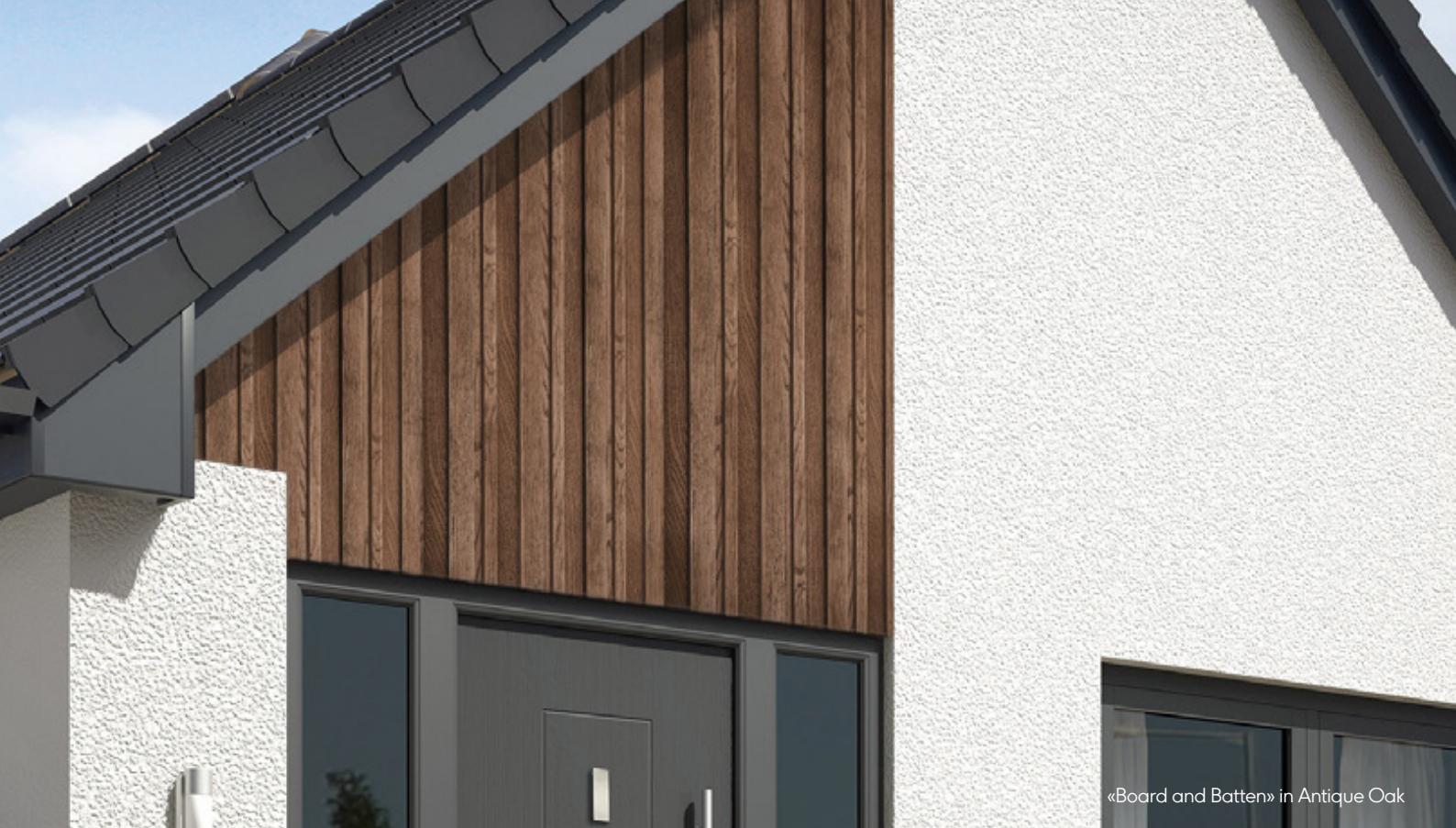
«Board and Batten» in Antique Oak