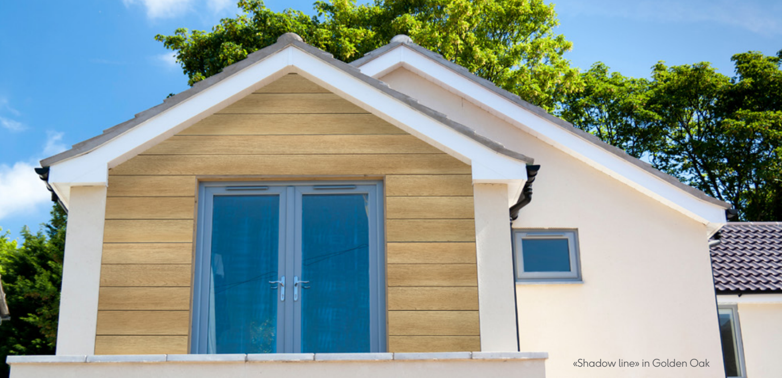
«Shadow line» in Golden Oak