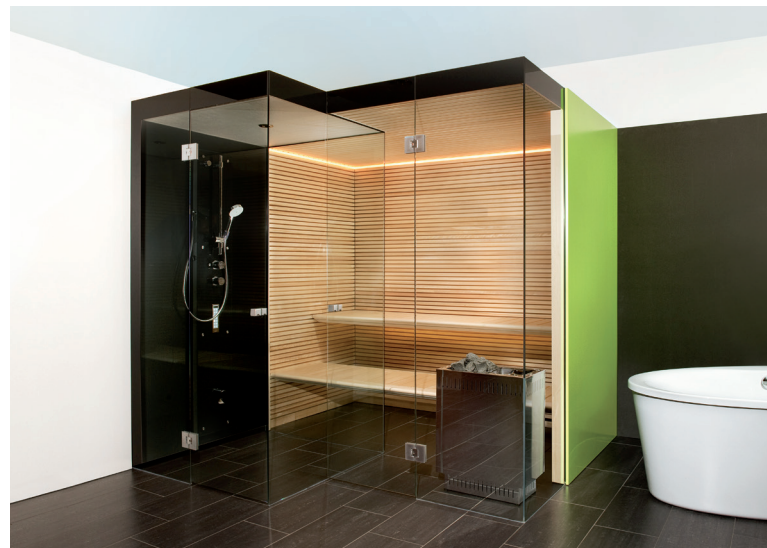
Insieme Due *Design geschützt

Dusche, Kopfbrause, Seitenbrausen, Nebeldüsen, Kneippschlauch, Farblicht-Therapie, Klang-Therapie, Aroma-Therapie, Sole, barrierefreien Duschboden, Rinne, Bodenablauf, Klappsitz, Sitzbank, Liege, Entlüftung, Kräuterdampfsitz, Dampfbrunnen mit Schale, Dampfpaneel, Dampfschublade, separater Technikbereich