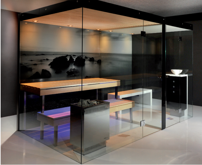
Insieme *Design geschützt