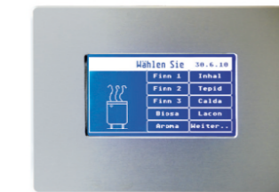
BIOSA® Touchscreen Modell CH-4

Die unterschiedlichen Temperaturen, Luftfeuchtigkeitswerte, Therapien und weitere Kabinenfunktionen werden auf leicht zu bedienenden Touchscreen-Steuerungen abgerufen. Es sind hauptsächlich in der Schweiz entwickelte und hergestellte Präzisionsgeräte. Sie halten auch das jeweilige Klima konstant und dadurch gesundheitsschonend.