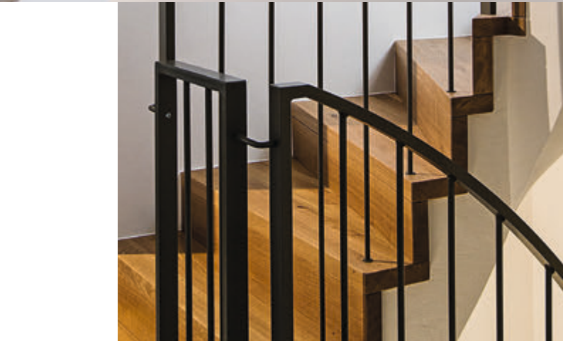
Seite 5: Stufen und Futterbretter in Eiche auf bestehende Betontreppe montiert. Geländer in Flachstahl mit Sprossen.